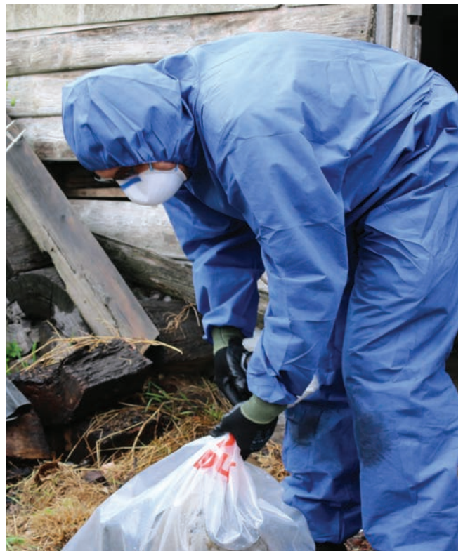
Luôn mặc quần áo bảo hộ khi làm công việc với các vật liệu có amiăng và thải bỏ ngay sau đó

PPE có bán trên thị trường tại các tiệm vật liệu xây dựng, tiệm bán thiết bị an toàn và một số tiệm ngũ kim (hardware).