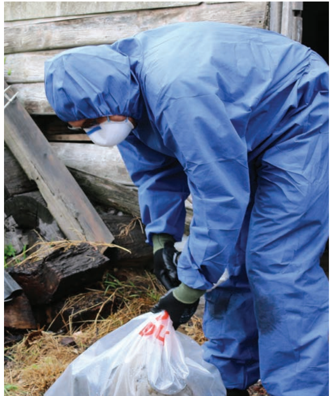
处理含石棉的材料时,务必穿上防护服,并在使用后立即处置。